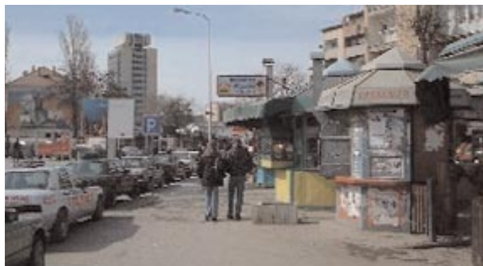
„Pristina – zwischen Krise und Neuanfang“

Für Jugendliche hat der Kosovo nicht viel zu bieten. „Dieses Bild zeichneten die Vertreter verschiedener Jugendinitiativen und Organisationen. 55% der Bevölkerung sind arbeitslos, viel Spielraum für eigene Initiativen gibt es also nicht und Freizeitangebote für Kinder und Jugendliche sind trotz zahlreicher kleiner Projekte rar gesäht.