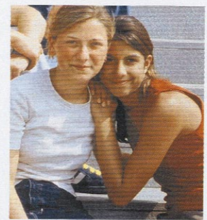
2. Wettbewerb zum Thema ‚Respekt‘