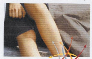
In Kooperation mit STEP 21 die Jugendinitiative für toleranz und verantwortung