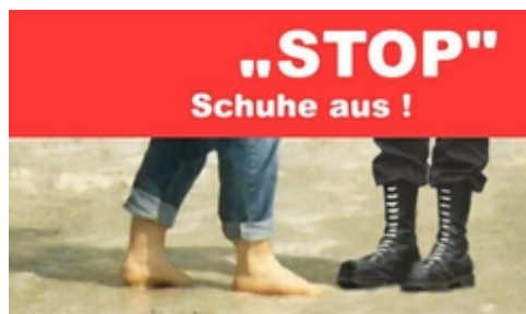
2. Platz "Stop - Schuhe aus"