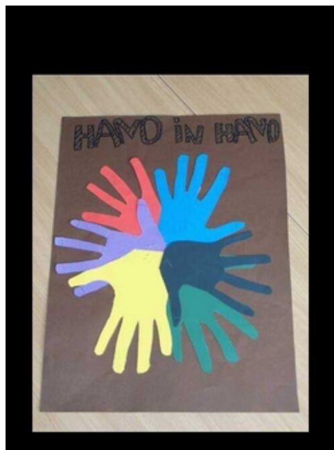
3. Platz "Hand in Hand"